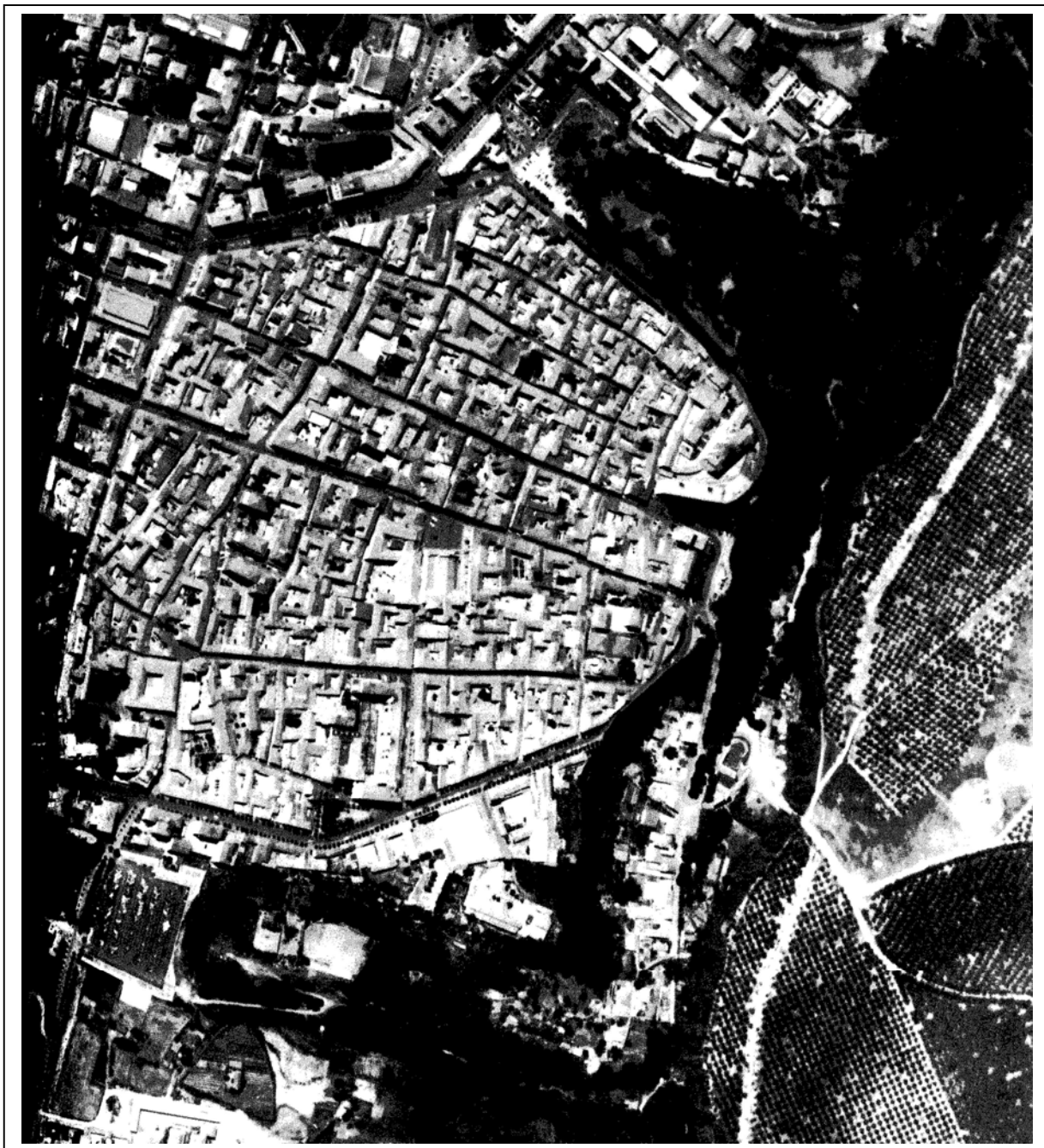
Veduta aerea zenitale del centro storico di Valenza.